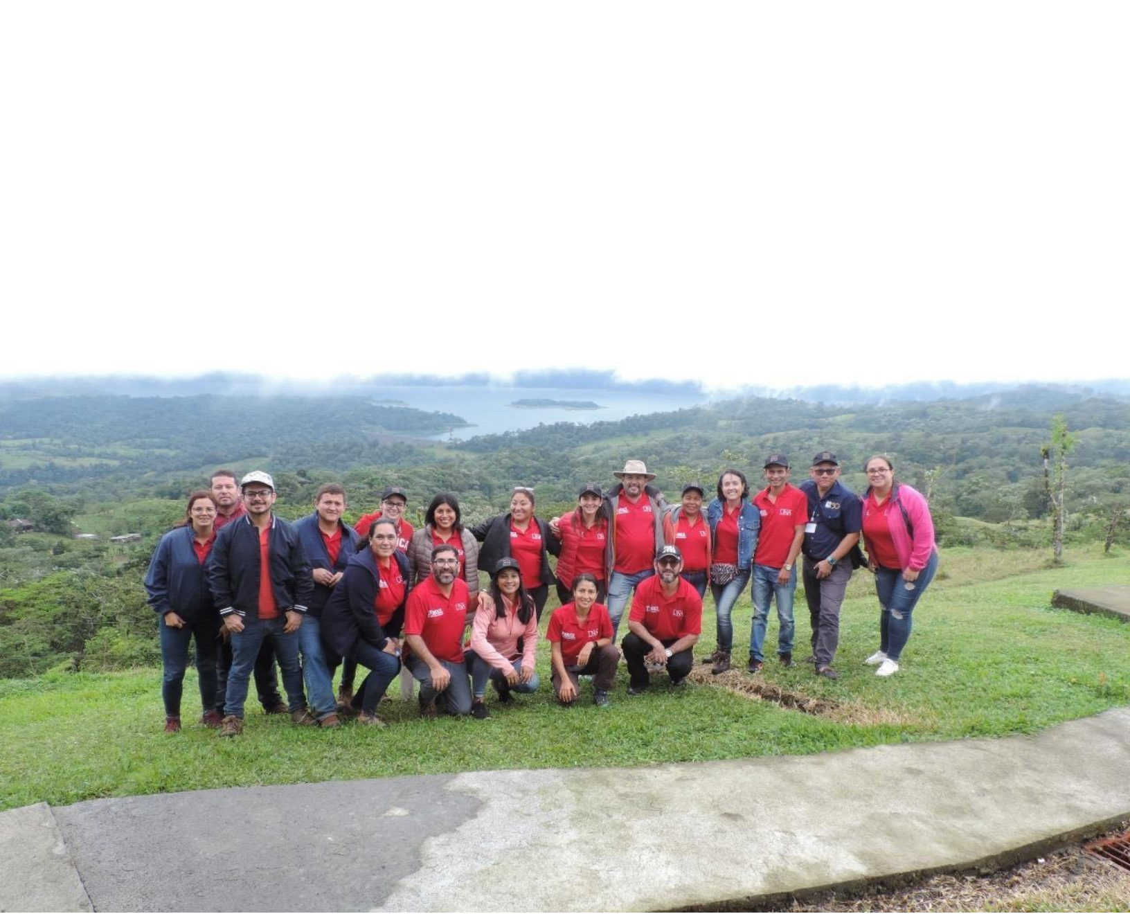
Seminario presencial en Costa Rica