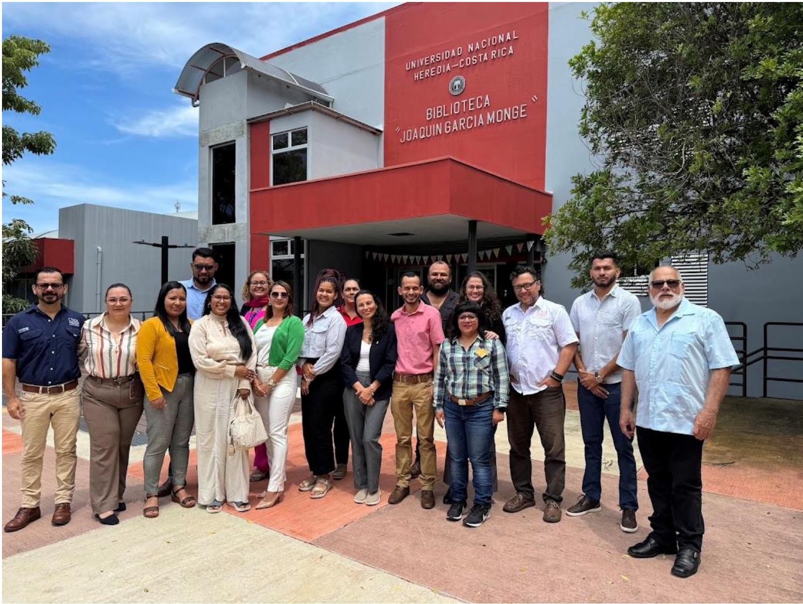
Seminario presencial en Costa Rica