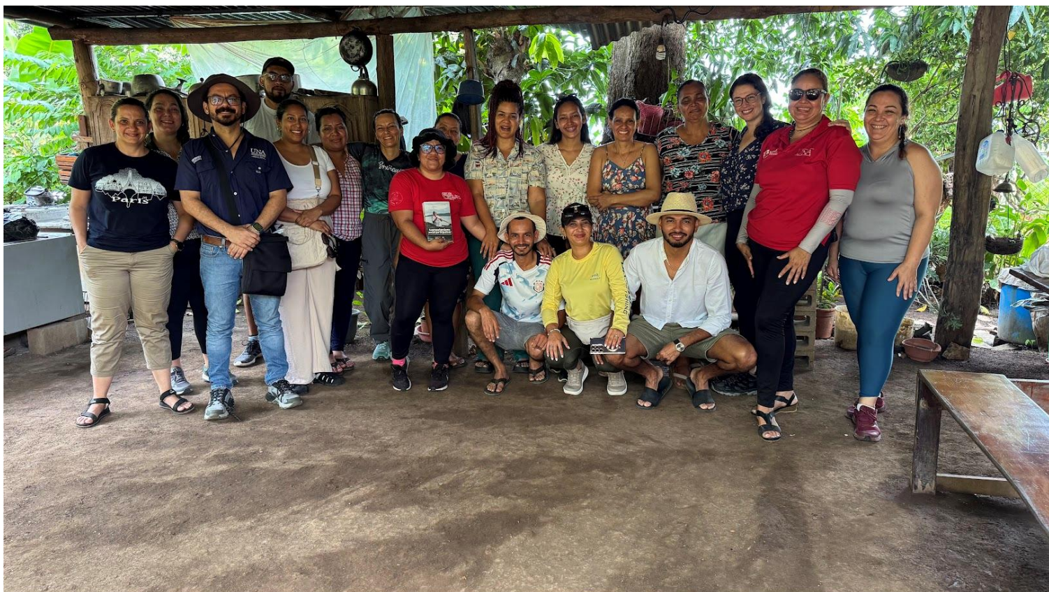
Seminario presencial en Costa Rica, reunión comunitaria en Isla Venado.